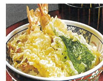
湘南しらすのかき揚げと 海老天丼