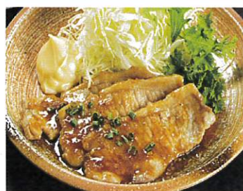
国産豚の生姜焼き