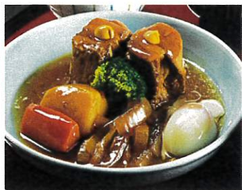
豚の角煮 温玉添え