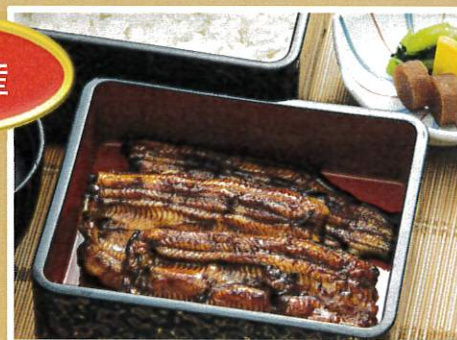
うな重「松」肝吸い付 ¥4,500