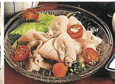
鹿児島県産 黒豚の冷しゃぶ定食 ¥1,400