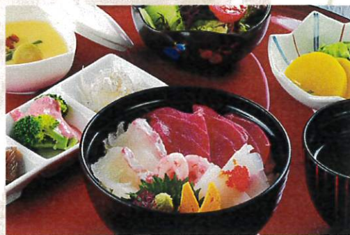
ミニ海鮮丼セット ¥1,350