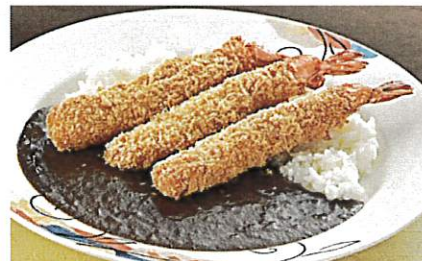
海老フライカレー ¥1,300