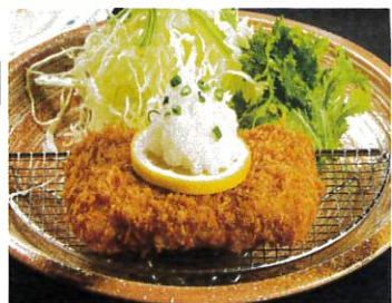
国産豚のヒレカツ 和風おろし