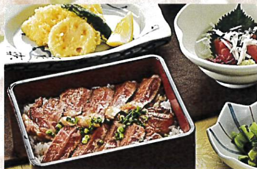
ステーキ重セット ¥2,000