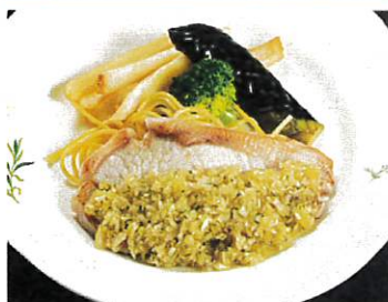
国産豚のポークソテー 和風オニオンソース