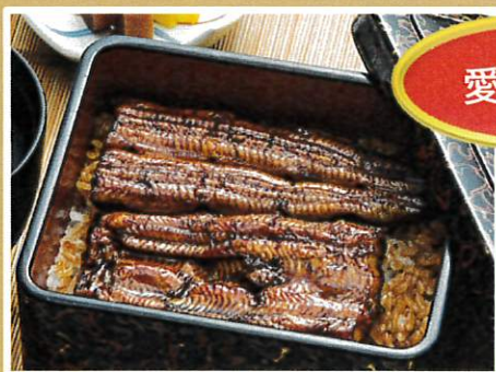
うな重「竹」肝吸い付 ¥3,500