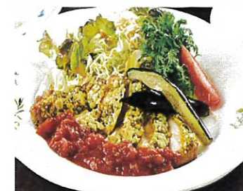
チキンの香草パン粉焼き