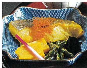
ぎんかれい 銀鯉の味噌漬焼き