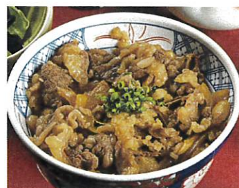
国産牛丼 温玉添え